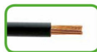
feindrätig, auch mit verzinneten Einzeladern

Der CAGE CLAMP'S-Anschluss klemmt folgende Kupferleiter: