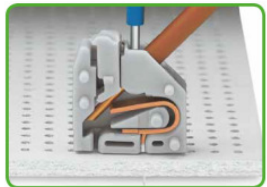
Prüfen mit Prüfstift 1 mm Ø, auf dem Leiter