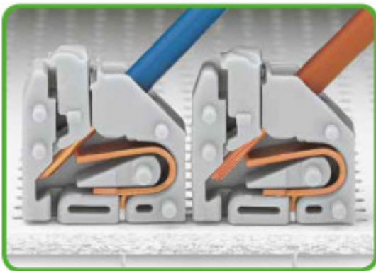
Eindrätige Leiter anschließen - stecken. Flexible Leiter anschließen - Druckerbetätigung